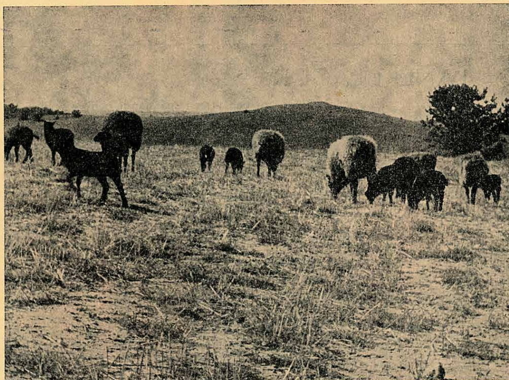
Hedlandskap från Albo härad